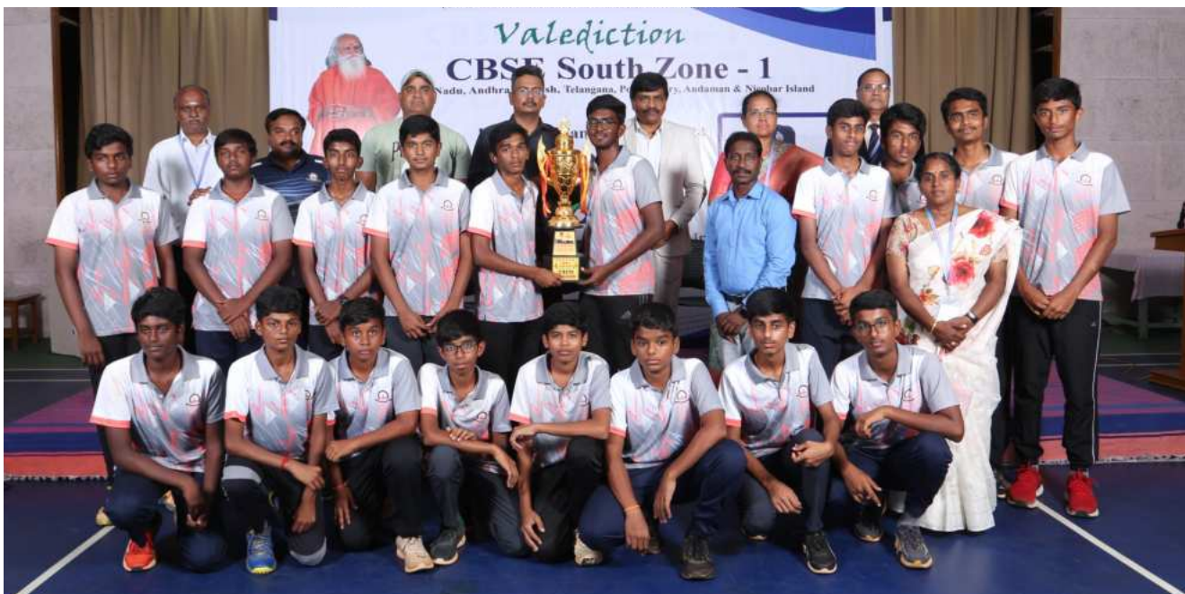
Under 17 - Boys Winners