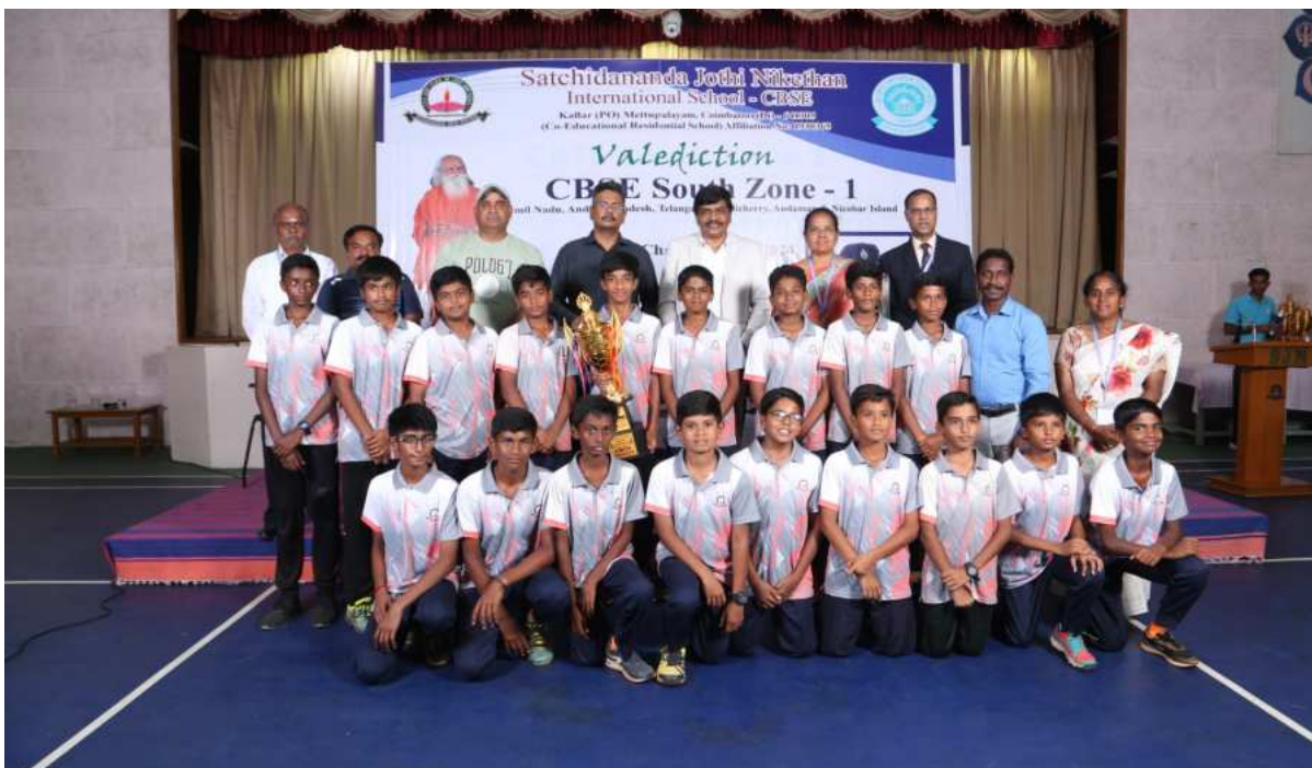
Under 14 - Boys Winners