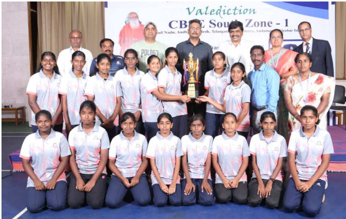
Under 14 - Girls