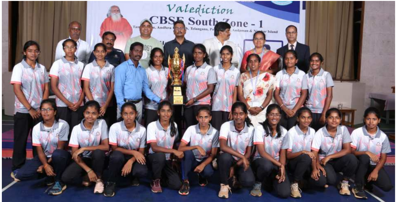
Under 19 - Girls Winners