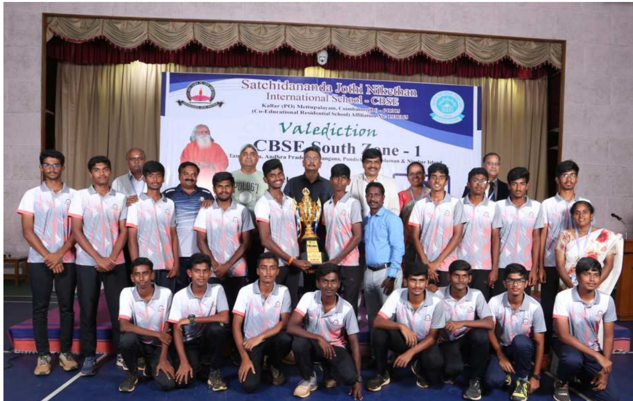
Under 19 - Boys Winners