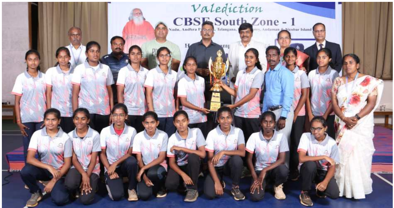
Under 17 - Girls Winners