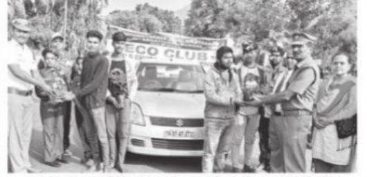
உதகை சாலையில் கற்றுலாப் பயணிகளுக்கு வழங்கப்பட்ட இலவச மரக் கன்றுகள்.

மேட்டுப்பாளையம், ஜூன் 5: உலக கற்றுச்சுழல் தினத்தை முன்னிட்டு மேட்டுப்பாளையம் சச்சிதானந்தா ஜோதி நிகேதன் பள்ளி சார்பில் விழிப்புணர்வு பேரணி, இலவச மரக் கன்றுகள் செவ்வாய்க்கிழமை வழங்கப்பட்டன.